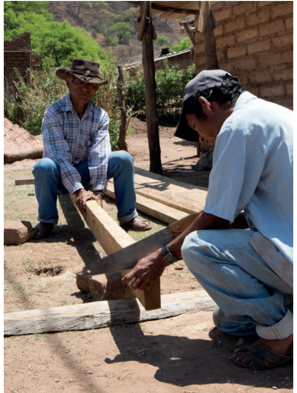
Salva Campillo / Ayuda en Acción

Reconocida por la Organización Mundial de la Salud (OMS) como una enfermedad desatendida por no recibir suficiente atención por parte de gobiernos e instituciones sanitarias, ocasiona anualmente 20.000 muertes. Aunque se trata de una enfermedad endémica en 21 países de Latinoamérica, los flujos migratorios han permitido su expansión a países donde antes era desconocida, como Estados Unidos, Europa, Canadá, Japón y Australia, por lo que ya se habla de enfermedad globalizada. Según datos de la OMS, se calcula que actualmente en el mundo hay unos 10 millones de personas infectadas por el parásito que causa la enfermedad