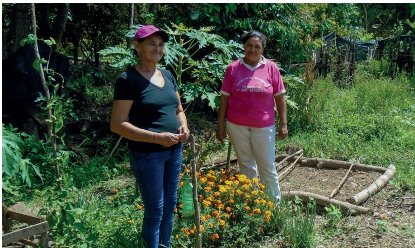
Ayuda en Acción Paraguay