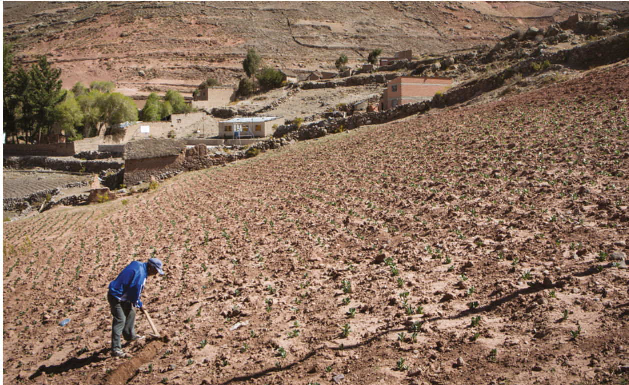
> Salva Campillo / Ayuda en Acción

los medios de vida de cientos de miles de personas.