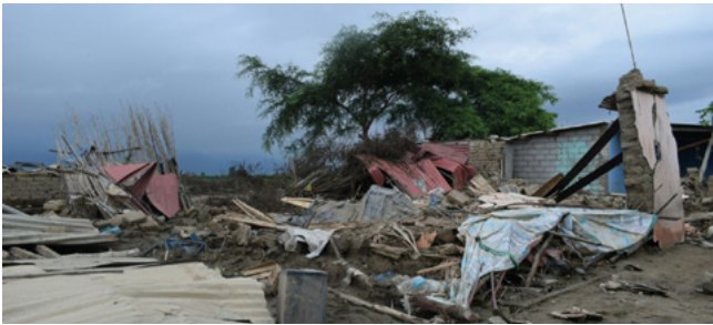
> Ayuda en Acción Perú

El agravamiento del fenómeno climático conocido como El Niño Costero fue el detonante de las lluvias que, el pasado mes de marzo, afectaron gravemente a la zona norte de Perú. A mediados del mes de abril, se contabilizaban 106 personas fallecidas y 155.000 damnificadas.